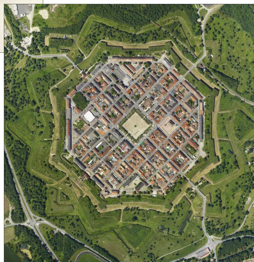
Non, il ne s'agit pas d'une maquette mais bien d'une photo verticale de la ville fortifiée de Neuf-Brisach, en Alsace.