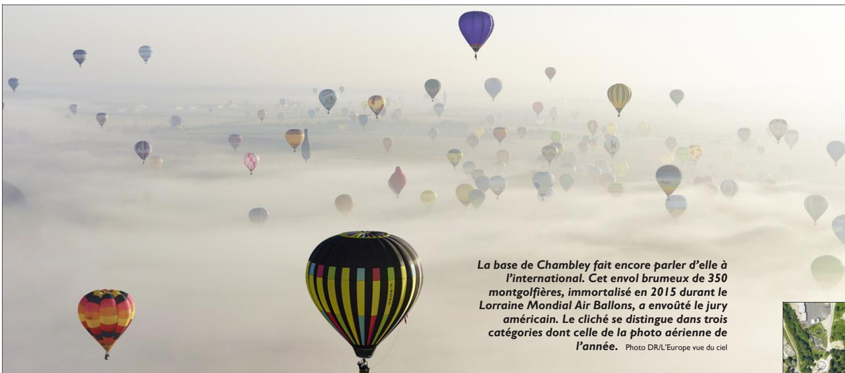
La base de Chambley fait encore parler d'elle à l'international. Cet envol brumeux de 350 montgolfières, immortalisé en 2015 durant le Lorraine Mondial Air Ballons, a envoûté le jury américain. Le cliché se distingue dans trois catégories dont celle de la photo aérienne de l'année.

La société chambleysienne L'Europe vue du ciel a été couverte de prix lors du récent concours organisé à Houston (Texas) par l'Association internationale des photographes aériens. Trois de ses clichés, dont une vue majestueuse d'un envol de montgolfières, ont hypnotisé un jury de professionnels.